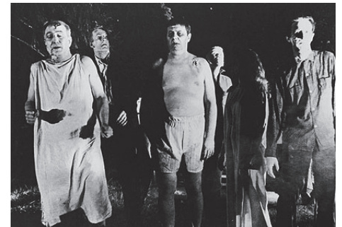
Cartaz de filme de 2007; cena de Dawn of the dead , 2004 (acima à dir.) e de Night of the living dead (1968)

indica, o vodu desenvolveu-se primeiro no Haiti entre os escravos que trabalhavam nos canaviais e incorporaram aos seus deuses nativos aspectos da religião de seus senhores”. O historiador acrescenta que “esse personagem ganhou mais tempero graças aos preconceitos de viajantes que, com sua visão colonialista, desprezaram o Haiti como local de sangrentos rituais de magia negra, orgias selvagens e mortos reanimados. O que acabou reforçado pela superstição nativa, sem falar na indústria de turismo e estrutura de poder haitiana. Vale lembrar que a ditadura Duvalier se utilizava das crenças religiosas locais como um dos sustentáculos de seu regime. E foi o cinema que deu maior dimensão ao zumbi e o redirecionou, desde as primeiras décadas do século XX, em filmes como Zumbi branco ( White zombie , 1932), com Bela Lugosi revivendo os mortos para trabalharem em sua plantação